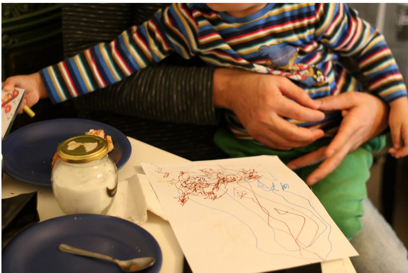
Familjerna på hotellet vittnar om trängsel och brist på lekutrymme för barnen.