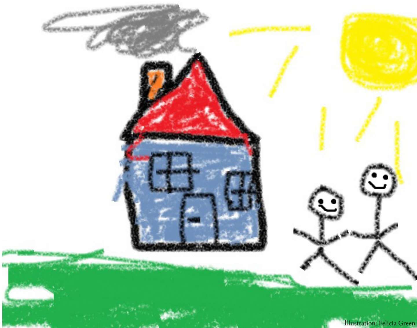
Illustration: Felicia Green

Hemlösheten har inte bara ökat, den har ändrat karaktär. Många som drabbas är barnfamiljer som inte lyckas ta sig in på bostadsmarknaden. Samtidigt som hemlösheten kostar staden flera hundra miljoner kronor lever 887 Malmöbarn i trängsel och ovisshet.