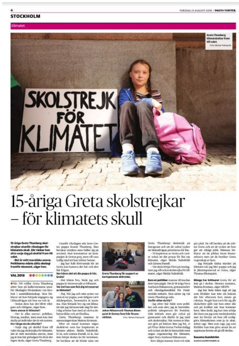
Fig 4, tidningssida Dagens Nyheter 20180823