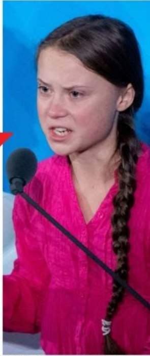
Greta Thunberg höll ett känslufyllt och dramatiskt tal för världens ledare under sitt besök hos FN.