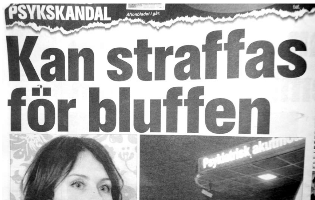
Faksimil ur Aftonbladet.