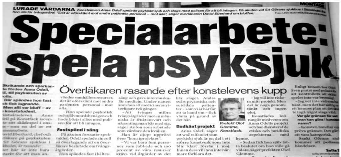
Faksimil ur Dagens Nyheter.

"Här blir det paradoxalt eftersom ett av konstens syften ofta sägs vara just detta: att berätta något om vad det innebär att vara människa i dag. [...] Provokationer kan inte uteslutas. Men de är ett medel, inte ett mål i sig. I så fall skulle det räcka att sätta sig och bajs på Sergels torg för att vara en fullgod konstnär."