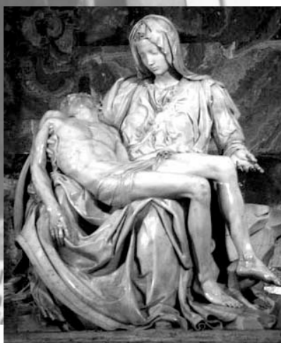
Originalen till Pietà skapades av Michelangelo 1499 och står i Peterskyrkan i Rom. Faksimil Aftonbladet Pietafotot Användare WTL Photos/Flickr