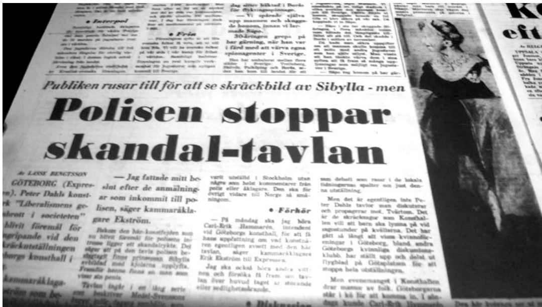
När Expressen publicerade sin Bild av Dahls tavla så censurede de prinsessans underkropp.

Fakta: Kritisk Realism , Wadell, Maj-Brit