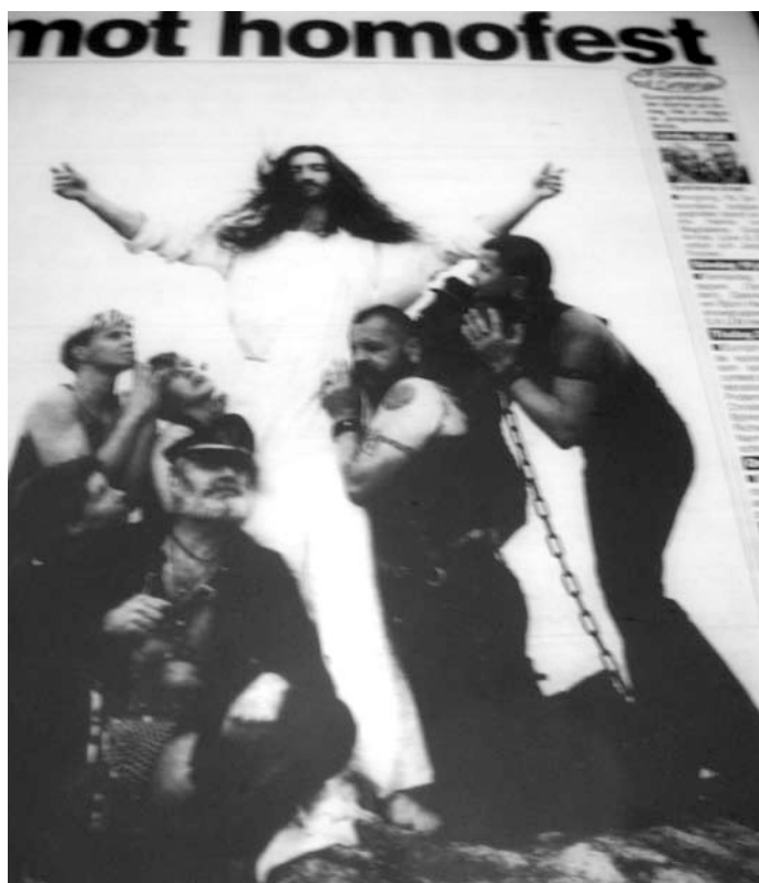
Veropet, Bilden är tagen på en mötesplats för homosexuella.