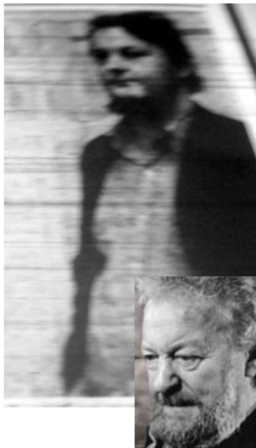
En bild på Peter Dahl från 1970 och en modern.

"...konstnärligt svag serie propagandistiska hatmålningar i vilken en angiven person, som inte är i position att försvara sig, utsätts för ett groteskt övergrepp på ett sätt som gör att man med skam och indignation lämnar lokalen" ur GHT