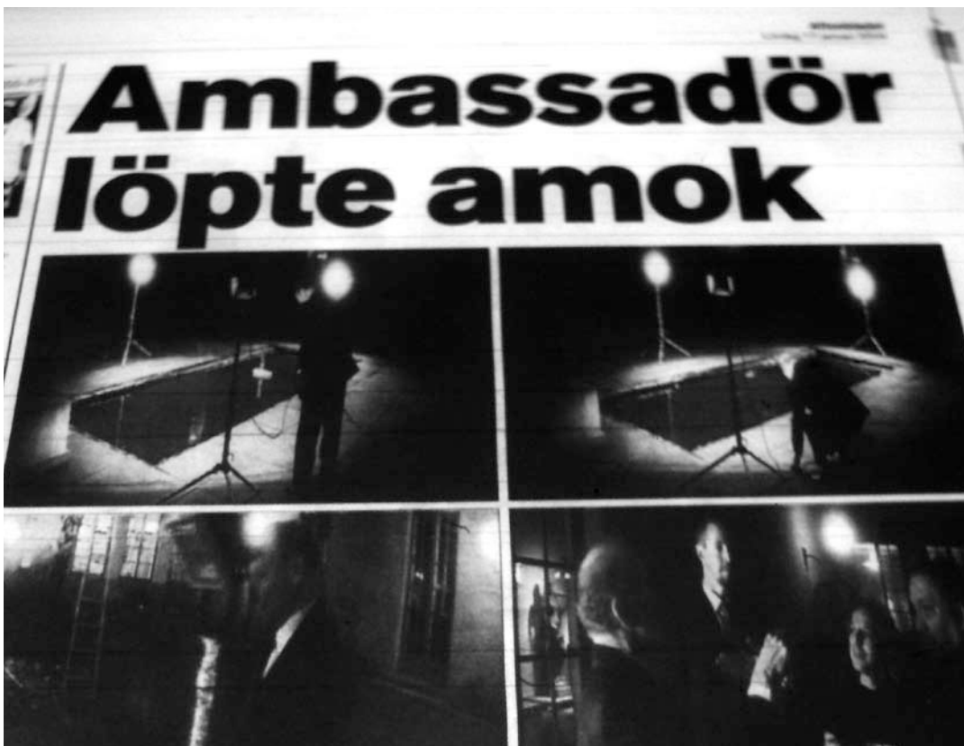
Faksimil ur Aftonbladet.