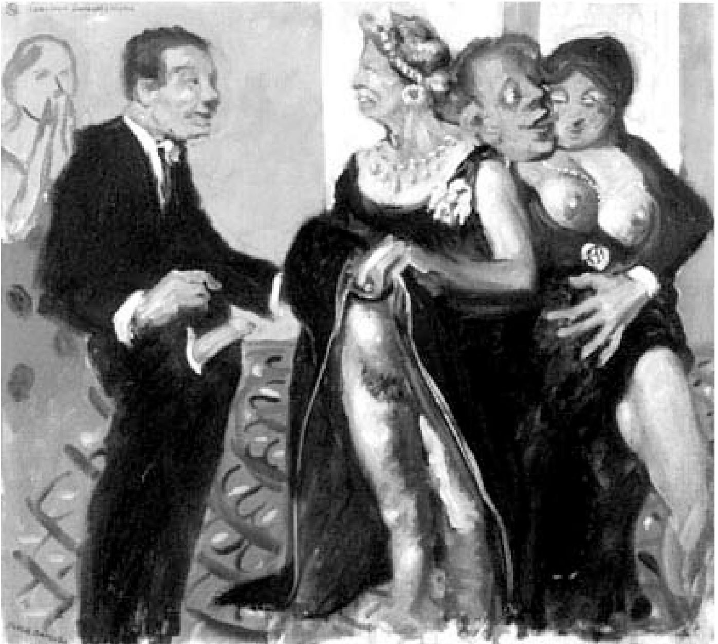
Liberalismens Genombrott i Societen.