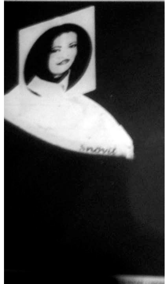
Faksimil ur Dagens Nyheter.